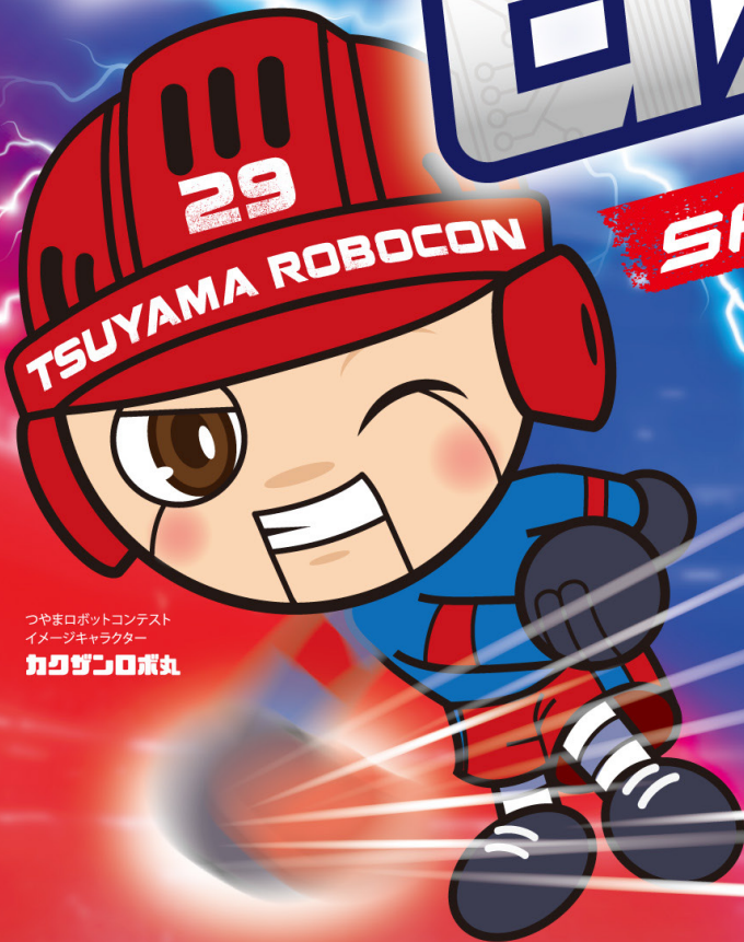
つやまロボットコンテスト イメージキャラクター カワザンロボ丸